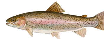
Trucha Arcoíris (Rainbow Trout)