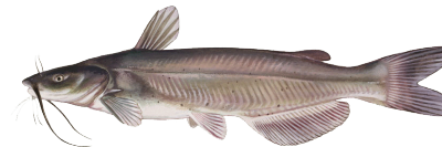
Bagre (Channel Catfish)