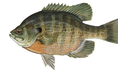
Especies de Pez Luna (Sunfish Species)