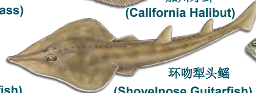
环吻犁头鳐 (Shovelnose Guitarfish)