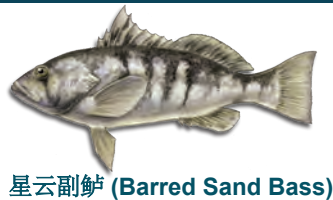
星云副鲈 (Barred Sand Bass)