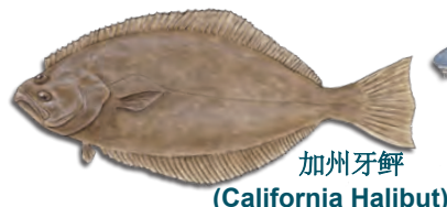
加州牙鲆 (California Halibut)