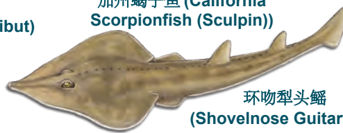
环吻犁头鳐 (Shovelnose Guitarfish)