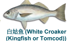
白姑鱼 (White Croaker (Kingfish or Tomcod))