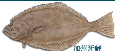
加州牙鲆 (California Halibut)