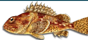
加州蝎子鱼 (California Scorpionfish (Sculpin))