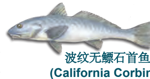
波纹无鳔石首鱼 (California Corbina)