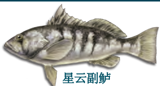
星云副鲈 (Barred Sand Bass)