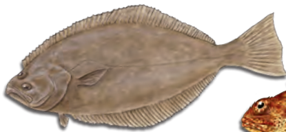
캘리포니아 납치 (광어) (California Halibut)