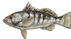
바드샌드배스 (Barred Sand Bass)