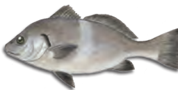
블랙 크로커 (흑민어) (Black Croaker)