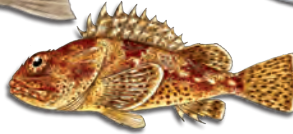
캘리포니아 썸뱅이 (California Scorpionfish (Sculpin))