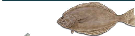
캘리포니아 넙치 (광어) (California Halibut)