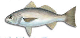
백민어 (킹피쉬 또는 톰코드) (White Croaker (Kingfish or Tomcod))