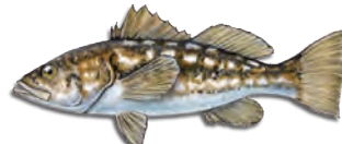
켈프 басс (칼리코 басс) (Kelp Bass (Calico Bass))