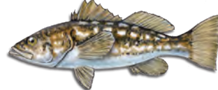
켈프 배스 (칼리코 배스) (Kelp Bass (Calico Bass))