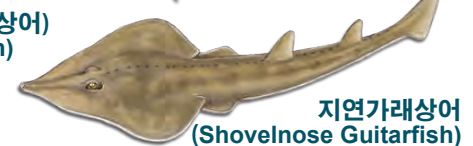
자연가래상어 (Shovelnose Guitarfish)