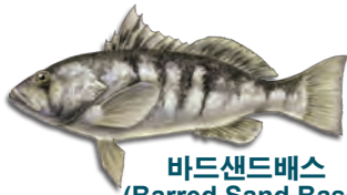
바드샌드배스 (Barred Sand Bass)