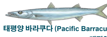
태평양 바라쿠다 (Pacific Barracuda)