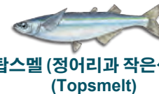
탑스멜 (정어리과 작은생선) (Topsmelt)