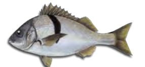
사르고 (백색 참돔) (Sargo)