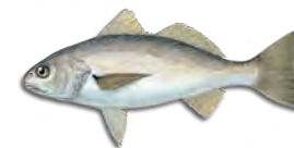
백민어 (킹피쉬 또는 톰코드) (White Croaker (Kingfish or Tomcod))