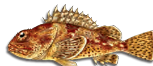
캘리포니아 썸뱅이 (California Scorpionfish (Sculpin))