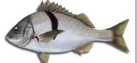
사르고 (백색 참돔) (Sargo)