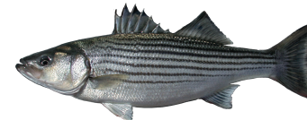
Lubina Rayada (Striped Bass)