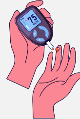
Personas con problemas de salud