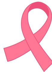
Mayor riesgo de cáncer