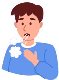
Problemas de respiración