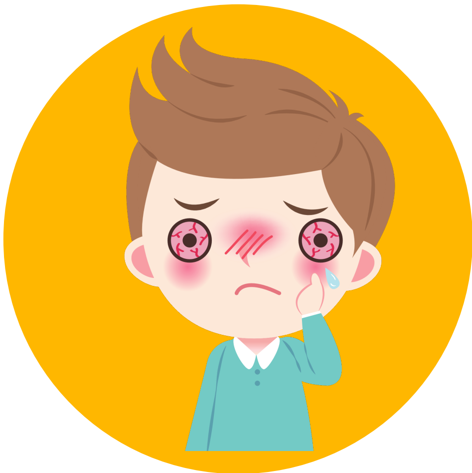
Ojos rojos, llorosos o irritados