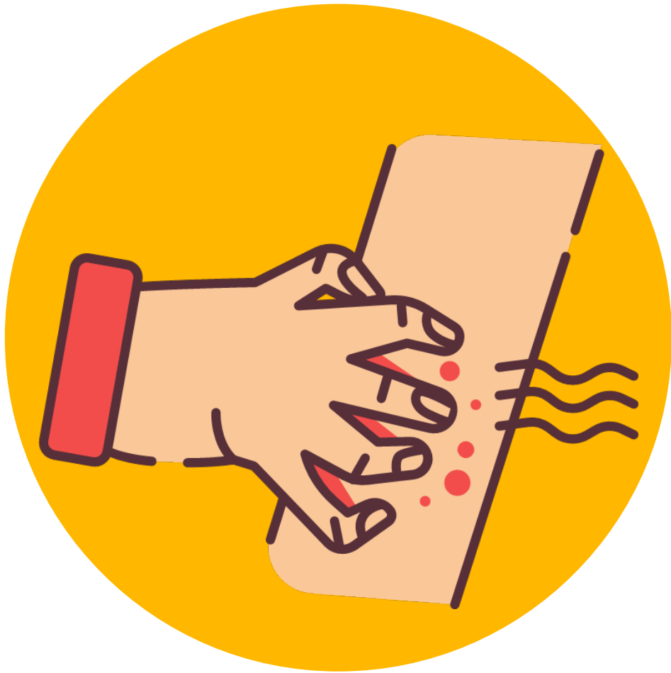
Sarpullido o piel irritada

Síntomas comunes de envenenamiento por pesticidas