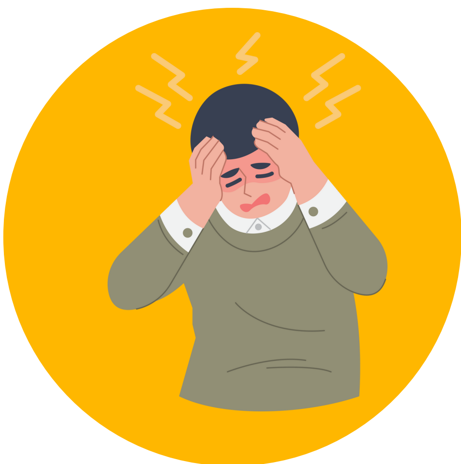
Dolor de cabeza, confusión