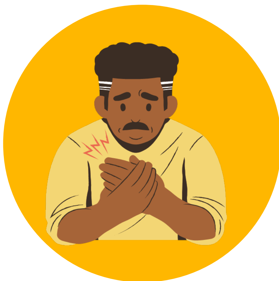
Dolor de pecho