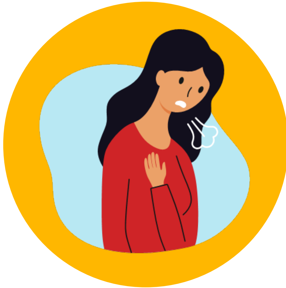
Problemas para respirar