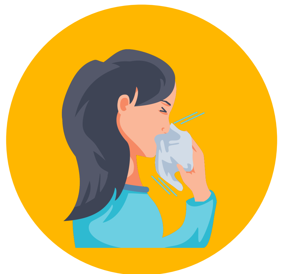
Tos con flema

Si de repente se siente confundido, tiene dificultad para respirar, no puede dejar de temblar o se desmaya, usted o alguien más deben llamar al 911 para pedir ayuda. Para recibir primeros auxilios o consejos después de una exposición a pesticidas, llame al Sistema de Control de Envenenamientos de California al 1-800-222-1222 .