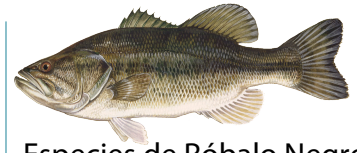
Especies de Róbalo Negro (Black Bass species)