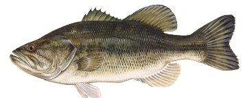
♥ Especies de Róbalo Negro (Black Bass species)