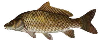
Carpa (Common Carp)