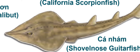
Cá nhám (Shovelnose Guitarfish)