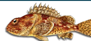
Cá lù đù biển (California Scorpionfish)