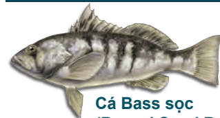
Cá Bass sọc (Barred Sand Bass)