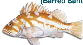
Các loài cá Rockfish