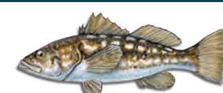
Cá hánh (Kelp Bass)