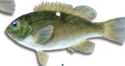
Cá sạo chám (Opaleye)