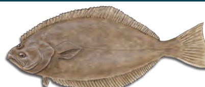
Cá thồn bơn (California Halibut)